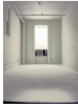
floating rock salt, fishing line, table salt | dimension variable | 2002 Art Front/Water Front—Site-Ations The Staten Island, Snug Harbor Cultural Center, N.Y,