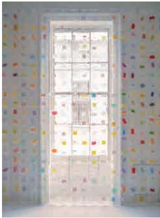
please wash away plastic, vinyl | dimension variable | 2002 Artist in Residence project at Snug Harbor Cultural Center, N.Y