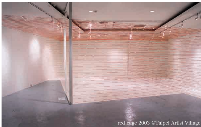
red cage 2003 @Taipei Artist Village